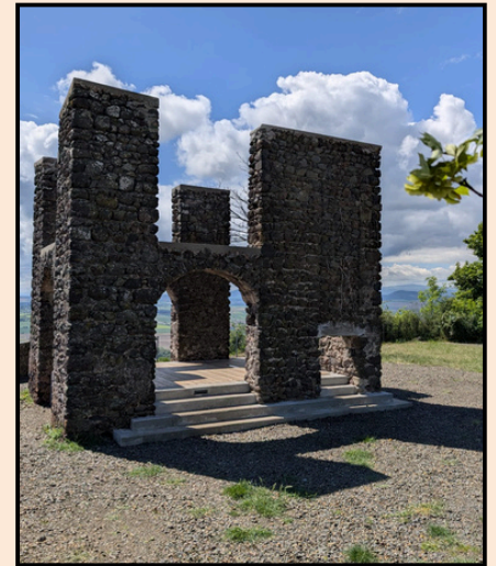
Rénovation de la maison avec la construction d'un plancher

Ce bâtiment, inachevé, est une curiosité du plateau. Ulysse vous raconte son histoire :