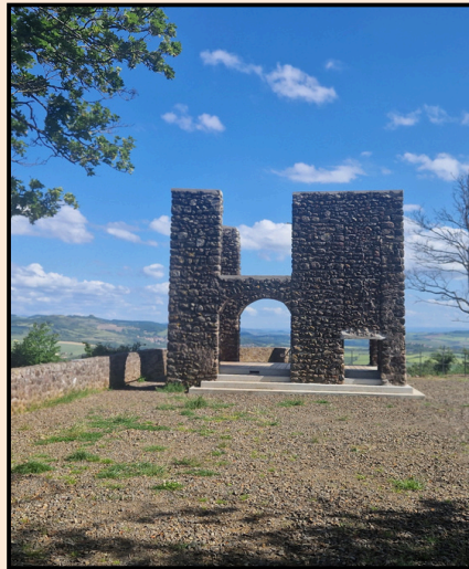
On remarque un mur doublé il comprend : le mur et la cheminée